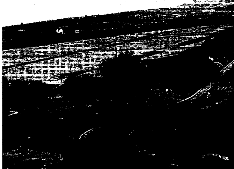
Los abogados defienden que la Ciudad de la Justicia en Los Gordales, como aprobó el PGOU