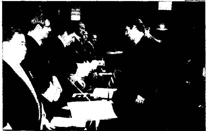
Un momento del acto de jura de nuevos letrados