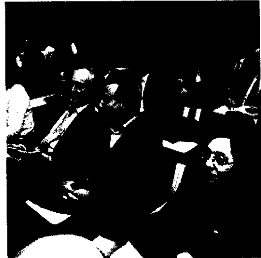
Junta General del Colegio de Abogados de Valladolid, ayer.