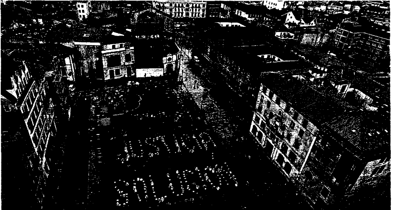
OVIEDO. Los funcionarios formaron ayer las palabras 'Justicia solución' en su protesta en la plaza de la Catedral.