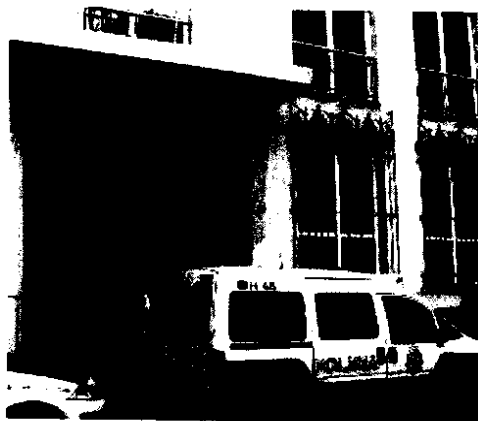
JUZGADOS. La actual sede ha quedado obsoleta.

La sobrecarga de trabajo no es el único inconveniente que soportan los abogados fuengirolenses. A este problema hay que añadir la falta de un espacio propio donde trabajar y atender a los ciudadanos en las tres sedes judiciales, y de aparcamientos propios. Tan sólo cuentan con una pequeña habitación donde recoger las solicitudes de oficio, sin que exista un despacho habilitado para trabajar y asistir a los defendidos. Por otro lado, la falta de aparcamiento retrasa considerablemente la labor de los abogados, en continuo ir y venir de uno a otro juzgado.