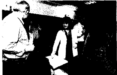
Una funcionaria deposita su voto en la urna para decidir sobre la huelga.

Así las cosas, la huelga se mantendrá en Segovia, donde, pese a los servicios mínimos que los sindicatos consideran «abusivos», han sido suspendidos más de 500 juicios desde que comenzó la huelga el pasado 4 de febrero, excepto en el Juzgado de Instrucción de Sepúlveda, que hasta el pasado 22 de marzo había celebrado los 73 juicios señalados, y el número 5 de Segovia, en el que habían tenido lugar los 14 previstos.