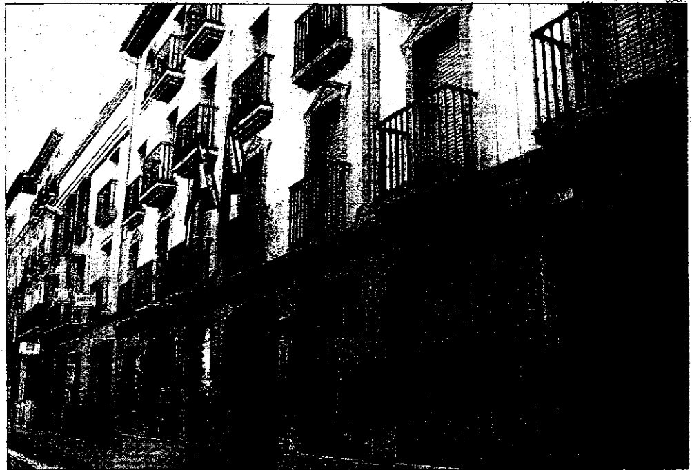
►► Fachada de los juzgados de Lucena.

Pese a la mejora que supuso en el 2001 la creación del tercer juzgado de primera instancia, el