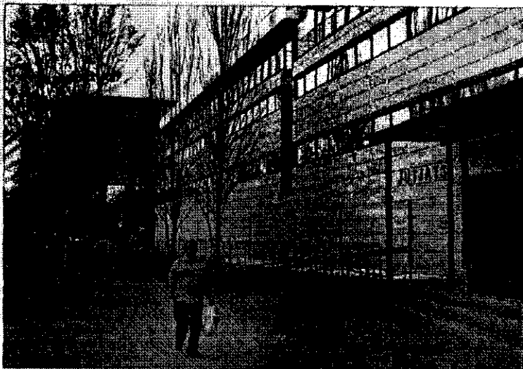
Imagen de archivo del edificio de los Juzgados de Reus.

Por otra parte, el Col·legi d'Advocats de Reus ha pedido a la Sala de Govern del Tribunal Superior de Justicia de Catalunya que se incrementa el número de abogados de guardia, «aunque esto es algo que depende de la Generalitat», puntualiza el decano. Actualmente,