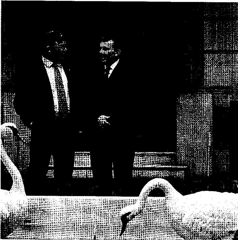
Juez y abogado conversaron sobre la situación del sistema judicial.

ble para mí que todo eso no esté controlado informáticamente, el saber que hay un preso en la calle, que no se ha ejecutado la sentencia, por ejemplo... Porque si hubiera unos programas informáticos en condiciones y se gastase el dinero en eso, esas cosas saltaban.