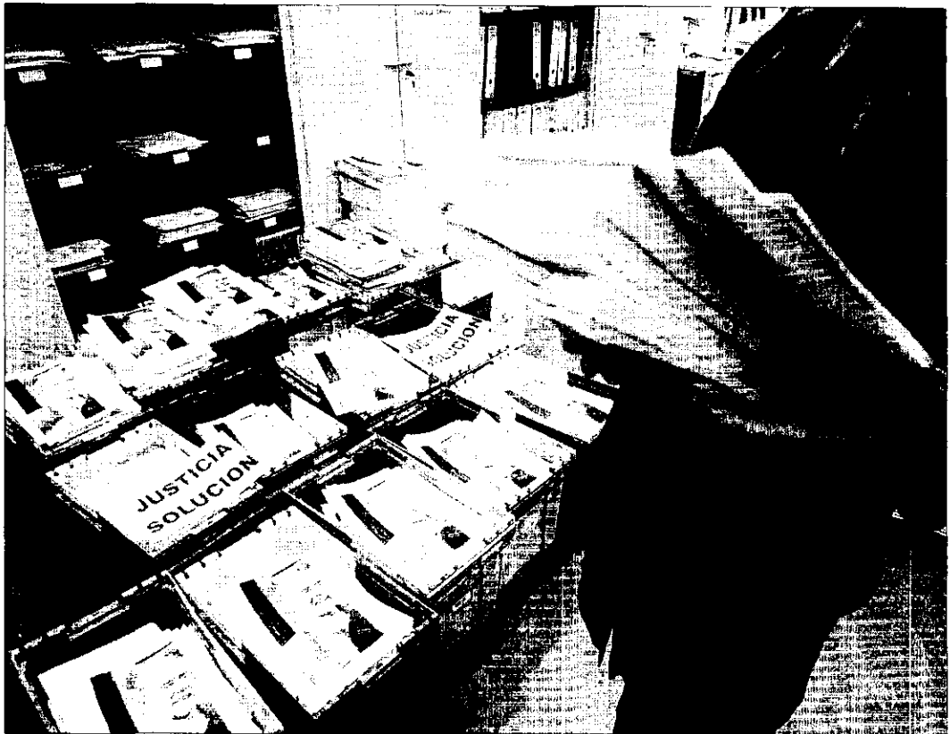
Las cajas donde iban amontonando los escritos en los juzgados durante la huelga.

Precisamente para elaborar esas actuaciones que permitan desatascar la justicia, los abogados reclaman que se les tenga en cuenta. So-