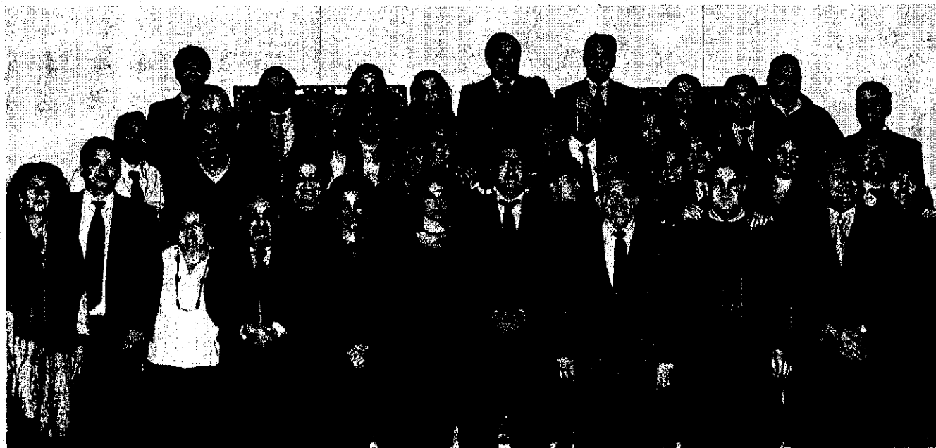
Los empleados del Colegio de Abogados con el decano en la foto de grupo de la última Navidad