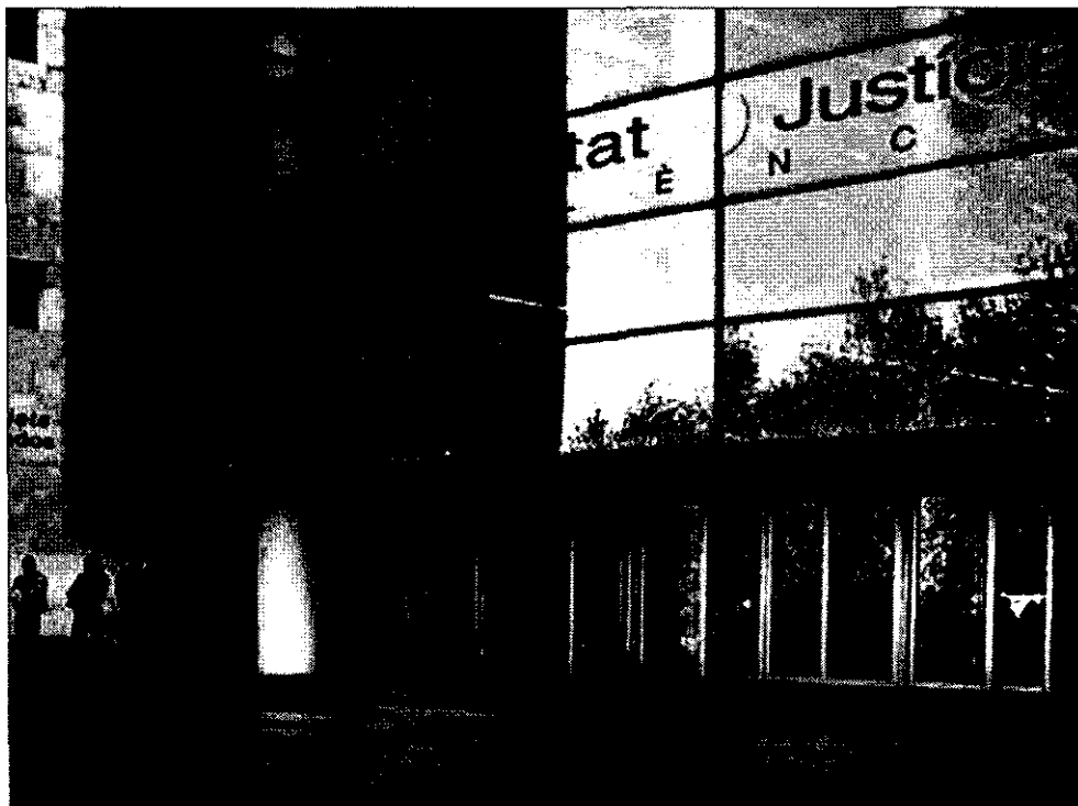
La entrada a la Ciudad de la Justicia de Valencia.

Haciendo de la necesidad virtud, la Administración de justicia