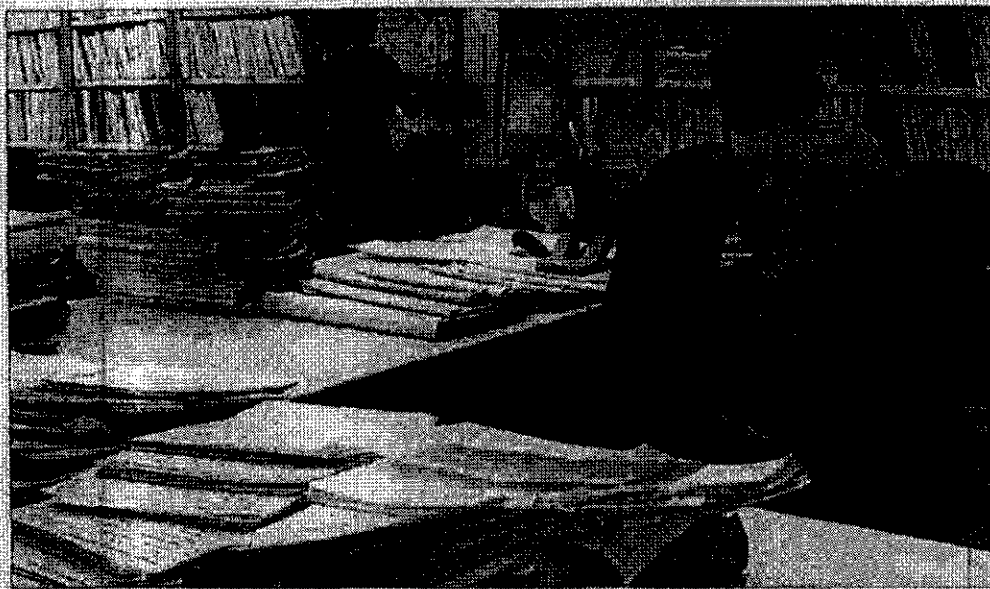
Pilar d'expedients que s'acumulen en un jutjat d'instrucció dels jutjats del carrer Foch a l'entrada de Granollers, en una imatge d'arxius

A partir de l'1 de gener, es faran dos dies de judicis ràpids als jutjats penals