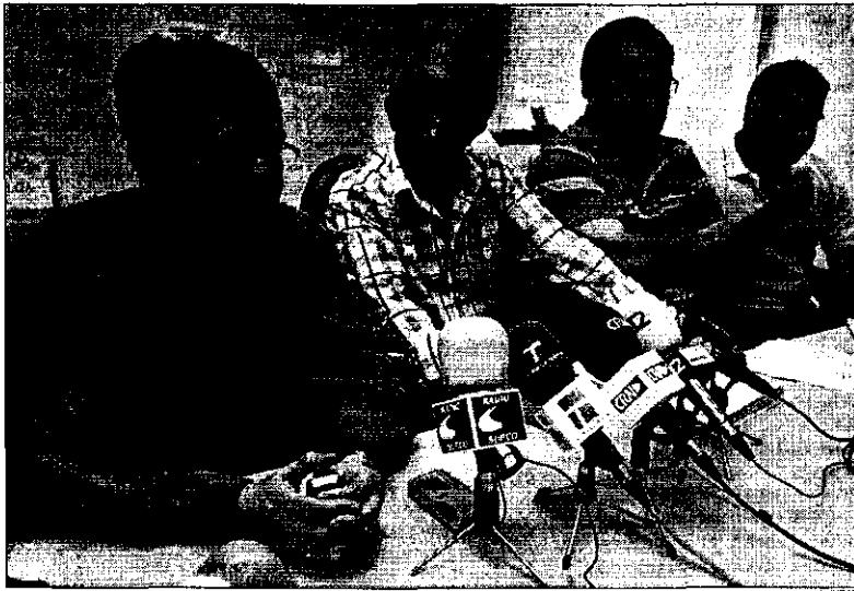
Los representantes de la Junta de Personal de Justicia durante la rueda de prensa

Asimismo, añadió que haber demorado el acuerdo que se firmó, y en el que consideran que la parte económica es satisfactoria aunque no se catalogue como una equiparación salarial sino como una subida, "ha sido consecuencia de la incompetencia de un ministro que no