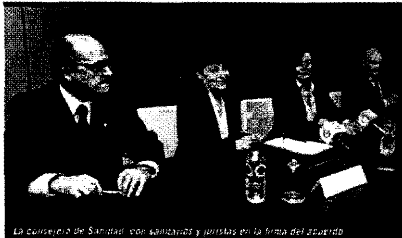
La consejería de Sanidad, con sanitarios y juristas en la firma del acuerdo

A los efectos de la prestación de la asistencia sanitaria, el colegio