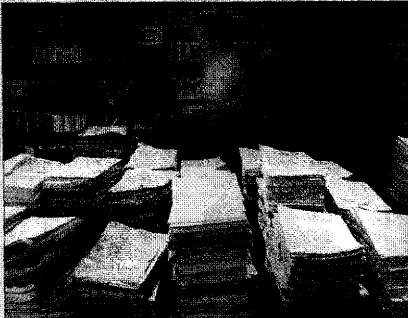
Cataluña es la comunidad autónoma con más asuntos legales pendientes

«Faltan más medios modernos, más recursos, y tanto jueces como funcionarios hacen lo que pueden», señaló Fuster Fabra. Cataluña tiene en estos momentos más de 56.000 casos pendientes, y según el letrado, «hay pocos funcionarios y demasiados interinos, los medios son obsoletos». Una situa-