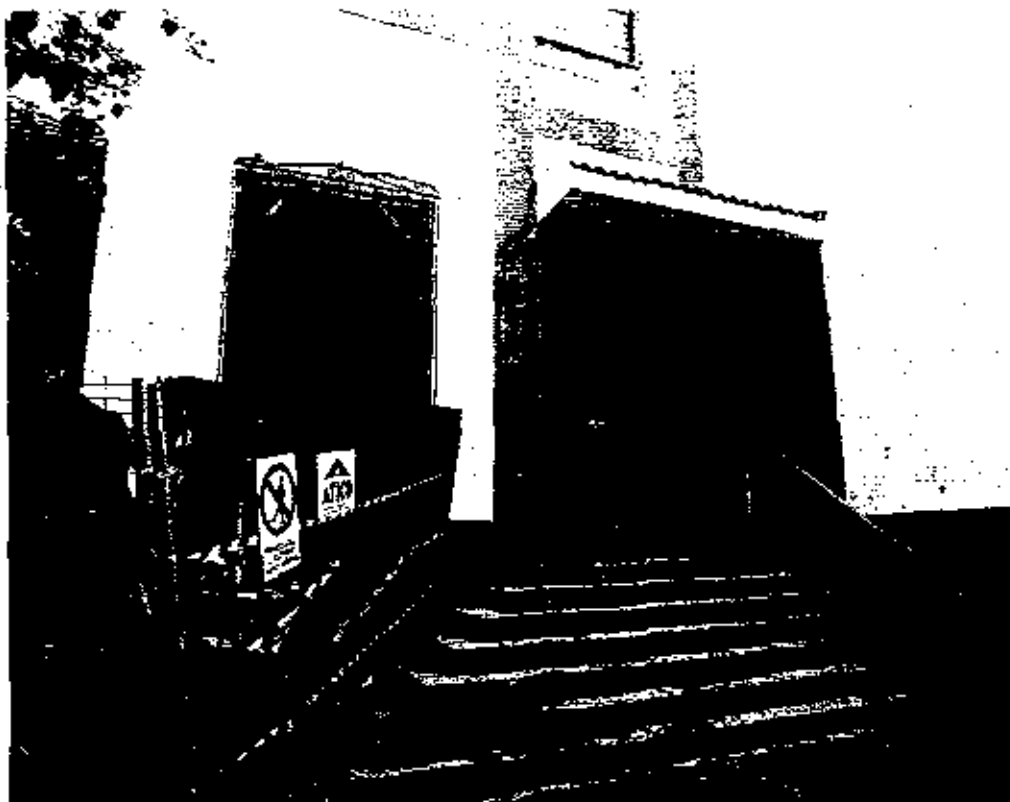
Sólo hay dos jueces atendiendo los casos en los Juzgados de Santa Cruz de La Palma y Los Llanos.