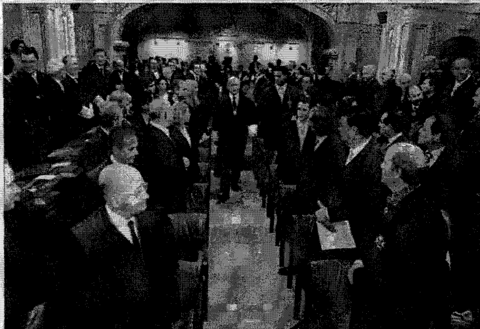
El acto oficial de los abogados se celebró en la tarde de ayer en la Diputació de Tarragona.

FIESTA PATRONAL ■ EL DECANO CONSIDERA 'INDIGNANTE' LA SITUACIÓN