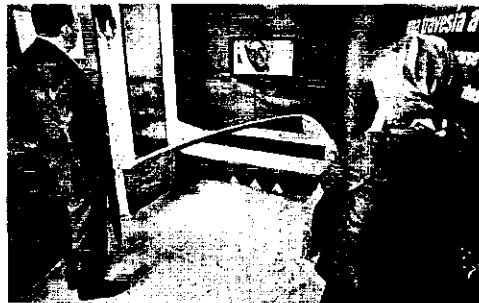
VIDEO. Uno de los espacios está dedicado a la inmigración.