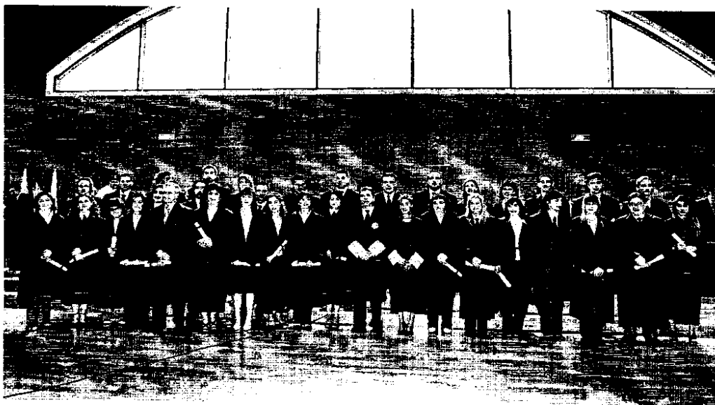
Foto de familia de los 35 nuevos abogados que se han incorporado al Colegio.