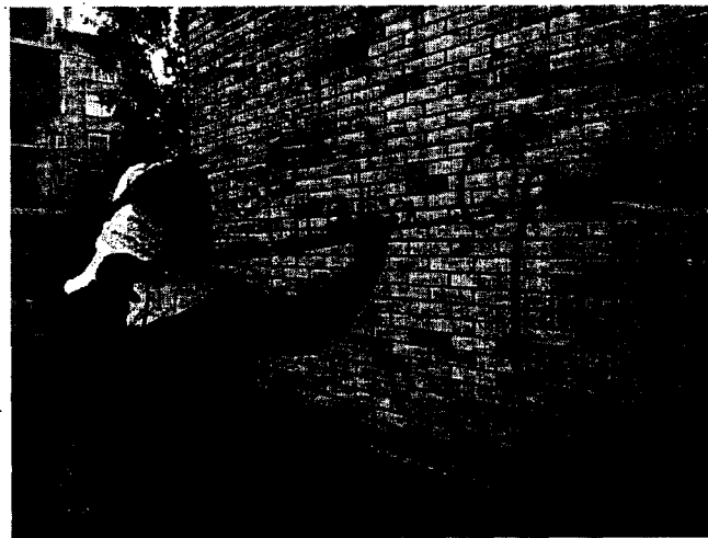
SANCIONES. Un operario limpia una pintada.

En materia de pintadas, sólo en el Casco Viejo se invirtió 220.000 euros para limpiar las paredes de consignas hechas a spray. «Los destrozos que originan los actos vandálicos –resumió el alcalde– obligan a la ciudad a gastar 645.000