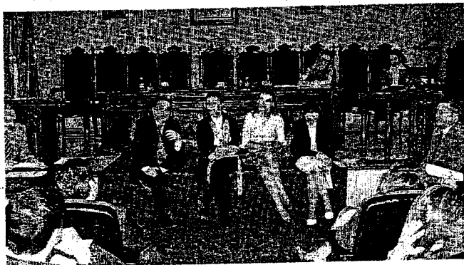
Presentación del primer grupo de abogados contra el maltrato.