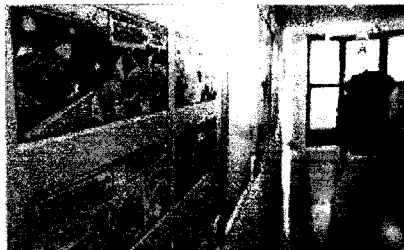
PARA REIR. La exposición recoge viñetas de, entre otros, Mingote o Chumy Chúmez.

En Jaén, la muestra podrá visitarse en horario de 9 a 13:30 horas y de 17 a 19 horas en la sede del Colegio de Abogados de Jaén (calle Carmelo Torres) hasta el próximo 13 de junio.