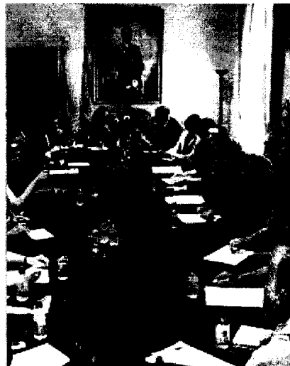
DEBATE. Asistentes a la reunión en la Subdelegación de Alicante.

La realidad afecta especialmente a Alicante, donde se calcula que están afincados la mitad de los inmigrantes sin papeles de toda la Comunidad, es decir, unos 75.000. De ahí que se escogiese la provincia para abrir una ronda de encuentros con entidades que, por su experiencia cotidiana, pueden aportar ideas interesantes.