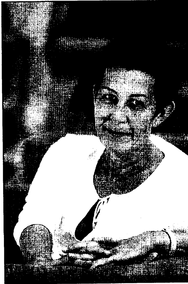
“Cuando la mujer toma su camino, se revela el machismo integral”.

—Fantástico. El factor humano es muy importante, un periódico no es nada si no es a través de sus redactores y redactoras. Fue una candidatura de los premios Olímpia del Lobby. Es importante no sólo la noticia en