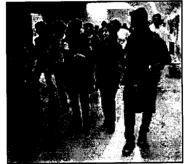
-- Jóvenes en el campus universitario cacereño.

El asesoramiento lo prestará un letrado, que será designado por el Colegio de Abogados, el cual convocará para ello la correspondiente beca, a la que podrán optar cuantos letrados estén interesados en prestar este servicio. El convenio establece que este letrado será incompatible para asumir asuntos o llevar a cabo actuaciones procesales que provengan de consultas atendidas en este servicio.