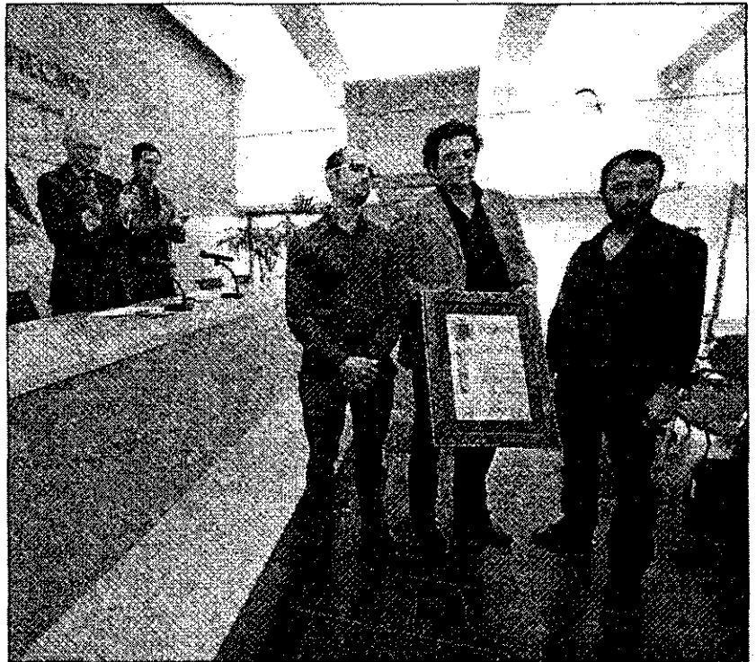
El equipo de tres arquitectos que se hizo con el primer premio

Asimismo, también se entregaron dos accésit a los 2 proyectos más, ela-