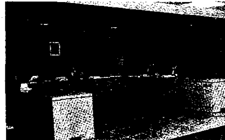
Imagen de un juicio en Arrecife.

Dentro de los datos sobre procesos judiciales relacionados con la violencia de género hay que distinguir entre los de carácter civil y los penales. En el caso concreto del partido judicial de Arrecife, a lo largo de 2006 se registraron diez nuevos casos por lo civil, cifra que cayó hasta los cuatro en el pasado año. Además, hace dos años se resolvieron tres casos frente a los doce de 2007 (las causas pendientes de resolución a finales de cada ejercicio pasaron de ocho a ninguno). En cuanto a la jurisdicción por la vía penal, las variaciones han sido mucho menores, también de-