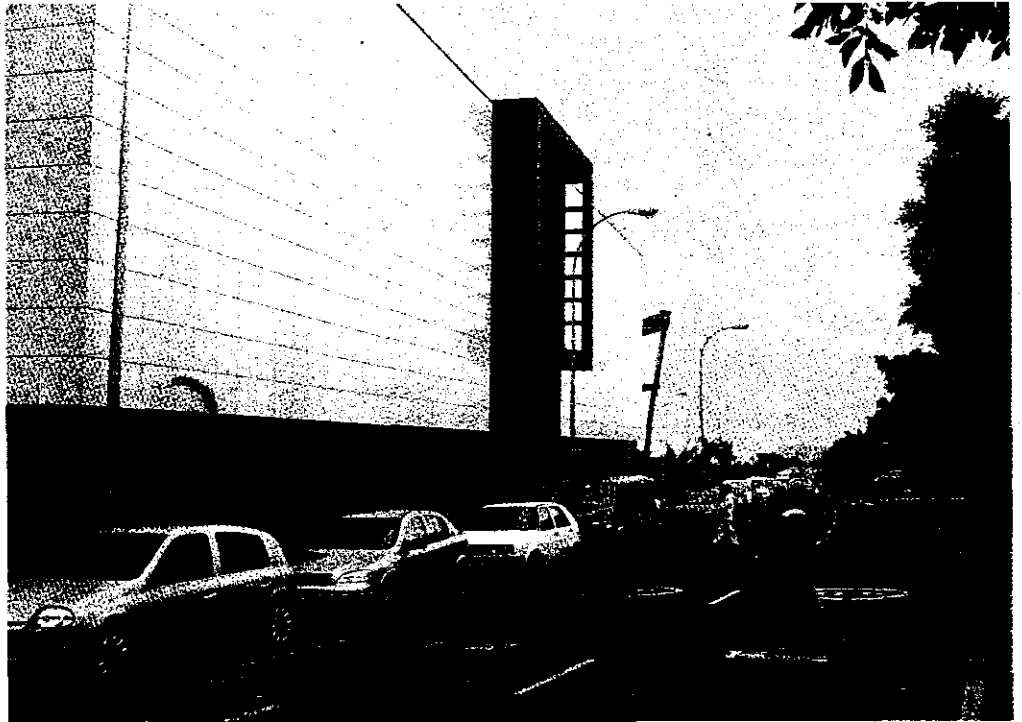
Sede de los juzgados en la capital lanzaroteña.

LOS SOCIALES. Sin embargo, es en los juzgados de lo Social, que por ahora mantienen el tipo, donde resulta más probable que se incremente de manera notable el caudal de procedimientos. En la actualidad operan en Lanzarote dos juzgados con una carga de trabajo que ha aumentado de forma sensible en los