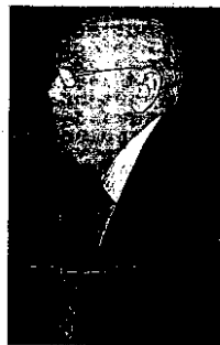
M. López Bernal.

El Ministerio Fiscal que dirige Manuel López Bernal incluyó entre sus demandas a la Consejería de Hacienda la creación de, al menos, doce nuevas plazas de fiscales (un 40% más de los que hay en la actualidad), además de las plazas de funcionarios que les auxilien en sus tareas, y también solicitó mejoras en las instalaciones y medios telemáticos para el desempeño de sus funciones.