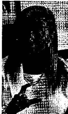
María Pedro Reverte.

El ministro visitó Murcia el pasado viernes y dijo que esperaba «con fervor» el traspaso de la Justicia a la Región. El Ejecutivo autónomo aún espera su propuesta sobre el plan de inversiones.