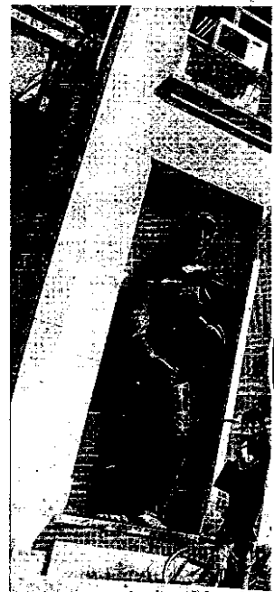
BAJO MÍNIMOS. Imagen de la

▶ Sedes judiciales: 22, de ellas trece en propiedad, aunque algunas en muy malas condiciones, y nueve en alquiler.