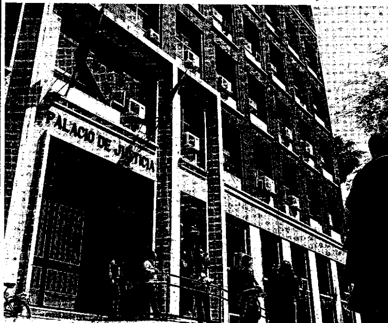
fachada del Palacio de Justicia de Murcia.