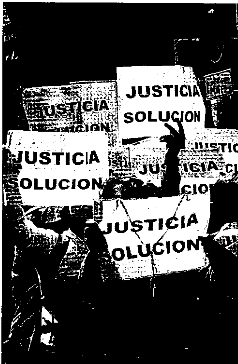
Protesta de funcionarios de Justicia durante la pasada huelga.

Sólo para la reparación de las malas condiciones en que se encuentran algunas sedes judiciales y la construcción de otras nuevas, por ejemplo en Lorca,