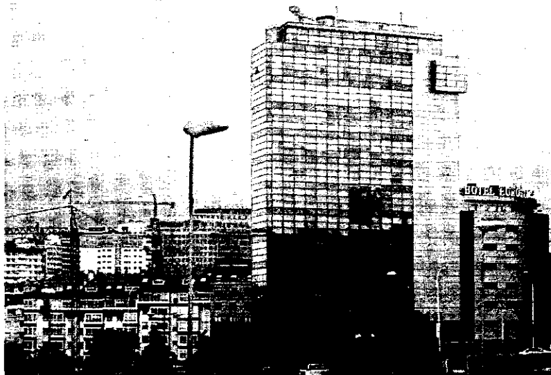
Las oficinas de la Xunta en el edificio Proa de Matogrande pronto estarán habitadas

Sólo durante 2007, este departamento tramitó cerca de 15.000 expedientes, tanto en papel como informatizados. Desde la Xunta explican también que el servicio no puede descartar ninguna documentación ya que se trata de expedientes "vivos" que en cualquier momento se pueden volver a necesitar. Por ello, los empleados necesitan tenerlos en las mismas oficinas para poder acceder fácilmente a los mismos.