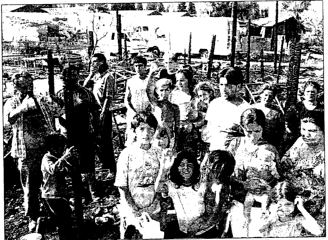
Algunas de las familias junto a los restos de sus chabolas en la barriada de El Vacie, Sevilla.