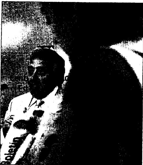
El director del Centro Reina Sofía en la presentación del boletín ayer.

El director del Centro insistió en la importancia del tratamiento que hacen los medios de comunicación