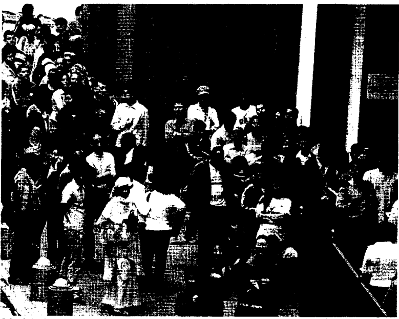
Colas de inmigrantes para regularizar su situación en las puertas de la Delegación del Gobierno.