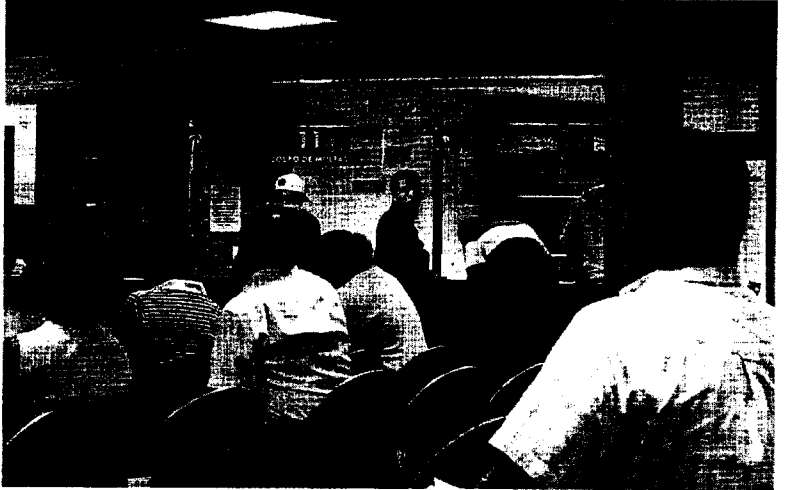
Interior de la Jefatura Provincial de Tráfico de Las Palmas, donde trabajaba el detenido.

Según ha podido conocer este periódico, la mayoría de los más de dos mil expedientes requisados corresponden a inmigrantes de nacionalidad colombiana, a la espera de comprobar si todos son falsos.