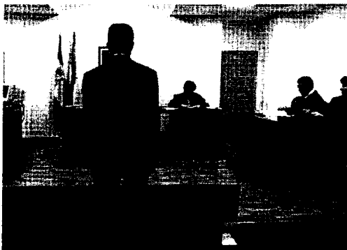
Los lucenses recurren cada vez más a la justicia gratuita

El Colegio de Abogados atribuye el notable incremento de peticiones a que los ciudadanos son cada vez más conscientes de las garantías que ofrece este servicio gratuito de defensa, al que pueden acogerse todas las personas cuyos ingresos no superen el doble del salario mínimo anual (12.849 euros), un límite que desciende en el caso de personas que tengan cargas familiares.