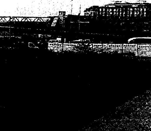
La Bohemia. Al fondo se ve el edificio judicial de Poniente.

De esta forma, los planes del Ayuntamiento pasan por concentrar al máximo todos los instrumentos de la judicatura, con el fin de facilitar tanto la labor de los profesionales como las gestiones de los ciudadanos. El futuro parece asegurado con un edificio que podría albergar los servicios de Prendes Pando, y las ampliaciones de salas que se puedan producir en un futuro y que la ciudad demanda desde hace años.