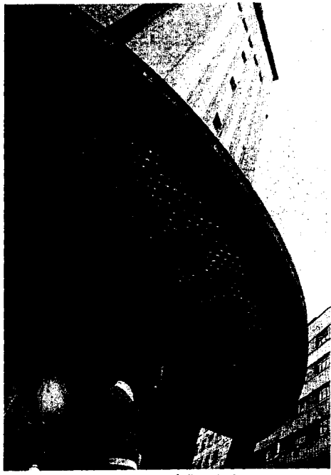
PISOS. Con la actual sede se podría financiar la nueva.

El decano del Colegio de Abogados añadió su opinión personal: «El lugar elegido no me parece mal, porque está al lado de los otros juzgados y de la Policía». La alternativa barajada hasta ahora, la llamada 'Casa Rosada', sita en el paseo de la Infancia, no dejaba de ser, en opinión del decano, «un apañajo para un par de años. Hay que pensar a largo plazo».