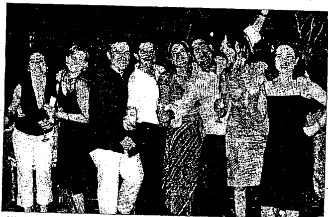
■ Más de 110 personas acudieron a la cena que se celebró en el Club Náutico de Aguadulce y que marcó el inicio de las vacaciones de los abogados almerienses.