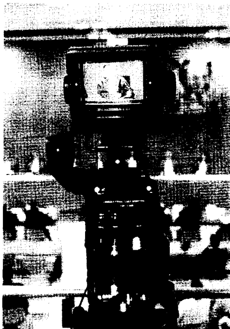
EN VIVO. Las cámaras captan la imagen y el sonido de la sala. / sur

Sin embargo, los casos penales se rigen por una norma que tiene «más de 200 años», según el testimonio de Arroyo, quien matiza que en este tiempo se han realizado diversas modificaciones de diferente calado. Aun así, parece que las nuevas tecnologías aún no han encontrado su turno en estas renovaciones.