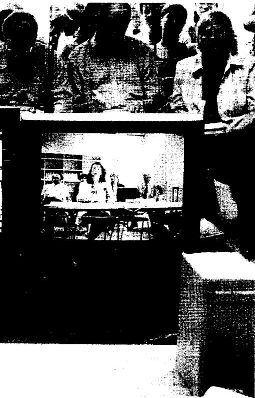
visionar cada juicio como un DVD. / sur