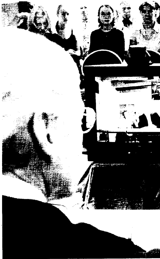
VENTAJAS. El sistema de grabación ofrece la comodidad de poder

«La sala del jurado alberga procesos que tienen una gran importancia y un enorme calado social. Estamos hablando de instalar dos pequeñas cámaras y un sistema de grabación, que no deben requerir un esfuerzo inversor desmedido»,