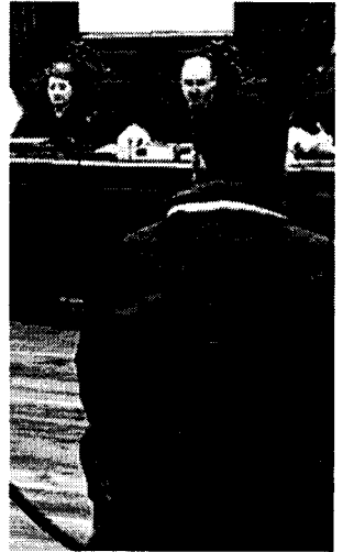
Un hombre espera la resolución que el juzgado.

Moderada implantación. A lo largo del ejercicio de 2003 y hasta finales del primer mes del presente año, se han celebrado en los juzgados de Jaén 3.410 juicios rápidos. Esta cantidad supone un poco más del nueve por ciento del total de los realizados en toda Andalucía. De este modo, Jaén se erige como la quinta provincia de la comunidad que más casos ha resuelto a través de los juicios rápidos por vía penal, detrás de Málaga, Sevilla, Cádiz y Granada.