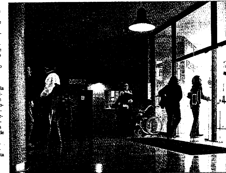
Imagen del Palacio de sa Gerreria, donde están ubicados los juzgados de familia.