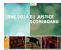
Segunda edición de la Clasificación Europea de Justicia