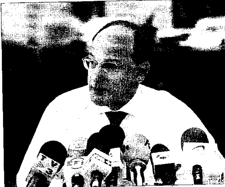
Gibraltar examina los derechos humanos.

El colegio de abogados de Gibraltar organizó ayer una recepción a los delegados inscritos en el simposio ayer por la noche, en las propias dependencias del hotel anfitrión. El plazo para registrarse en la convocatoria expiró precisamente en la tarde de ayer.