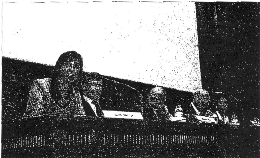
► Mesa presidencial del acto inaugural del congreso.

A las jornadas, que serán clausuradas mañana, asisten 987 congresistas de toda España. La primera edición, que se celebró hace diez años, también tuvo su sede en la capital aragonesa, considerada como una de las pioneras en la prestación de estos servicios junto a Madrid y el País Vasco. ■