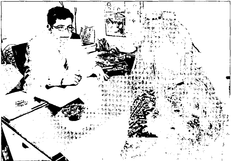
Tres letrados atendieron de manera gratuita las consultas de los ciudadanos

«Es que una consulta con un abogado ya te cuesta mucho dinero, unos 60 euros», comenta Lola, otra de las personas que espera para ser atendida. En su caso se trata de sa-