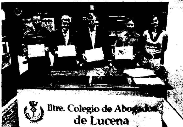
Los integrantes del jurado muestran los trabajos ganadores.