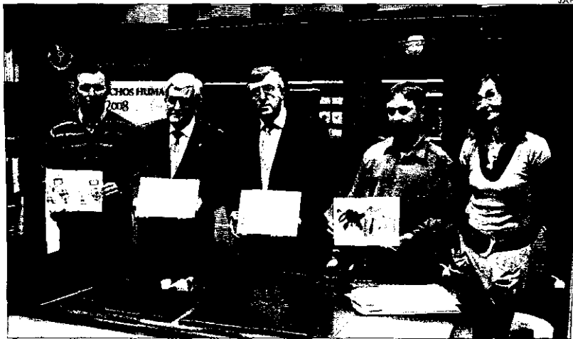
►► Miembros del jurado con los dibujos ganadores del concurso.