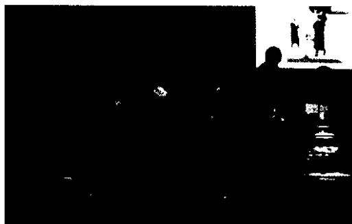
COLEGIO DE ABOGADOS. Alumnos de Derecho recogen un diploma del curso anterior.

Lo que van a leer ustedes a continuación puede parecer un chiste, sin embargo se trata de un caso real acontecido en los tribunales de justicia españoles. La historia sigue de la siguiente manera: un abogado interroga al médico forense que realizó la autopsia del cliente que defiende el primero. En sus ansias por demostrar la posibilidad de que la víctima estuviera viva, el letrado pregunta al forense si comprobó el ritmo cardíaco del cadáver antes de practicarle la autopsia, a lo que el médico responde que no. «¿Comprobó, acaso, su respiración?», se interesa el abogado. La respuesta del forense volvió a ser «no».