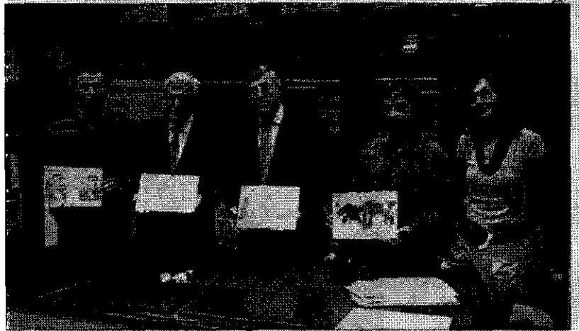
►► Miembros del jurado con los dibujos ganadores del concurso.