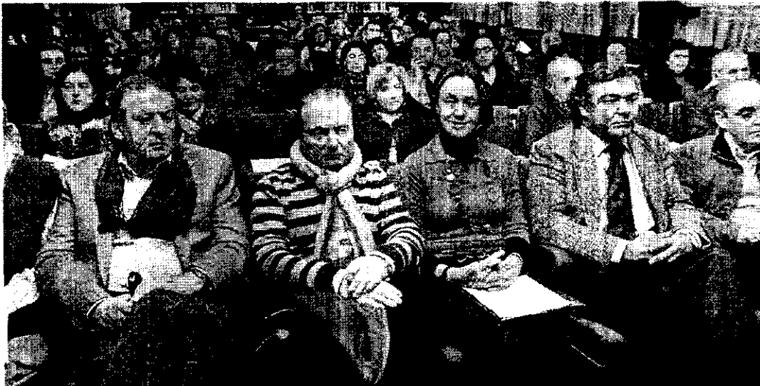
ASAMBLEA. El salón de actos del Colegio de Abogados de Gijón se quedó pequeña para acoger a los letrados.