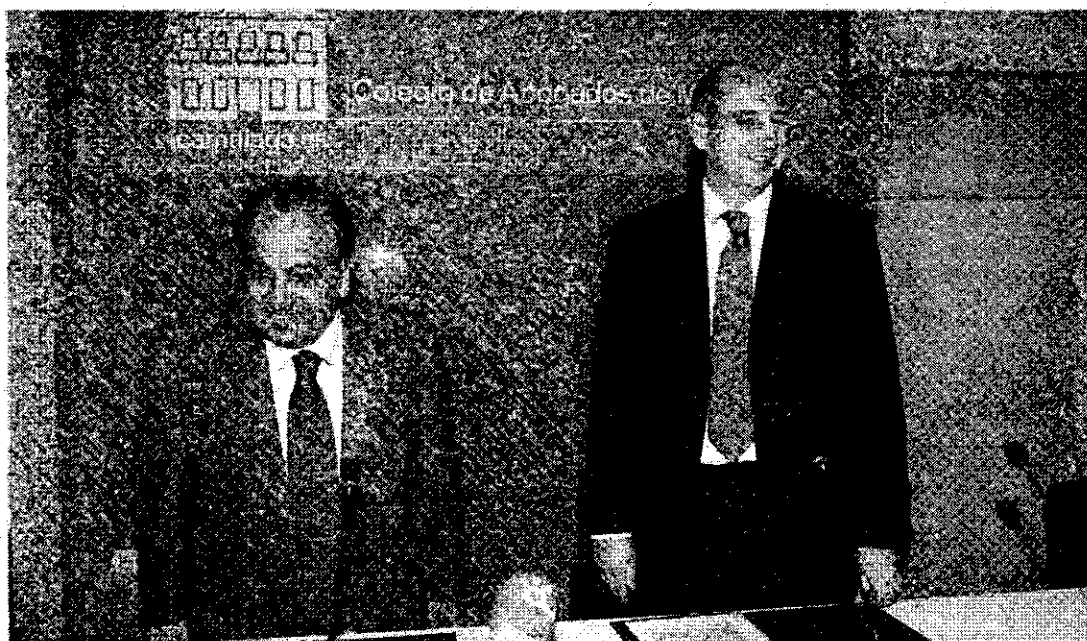
PRESENTACIÓN. Los cursos se dieron a conocer ayer en el Colegio de Abogados.