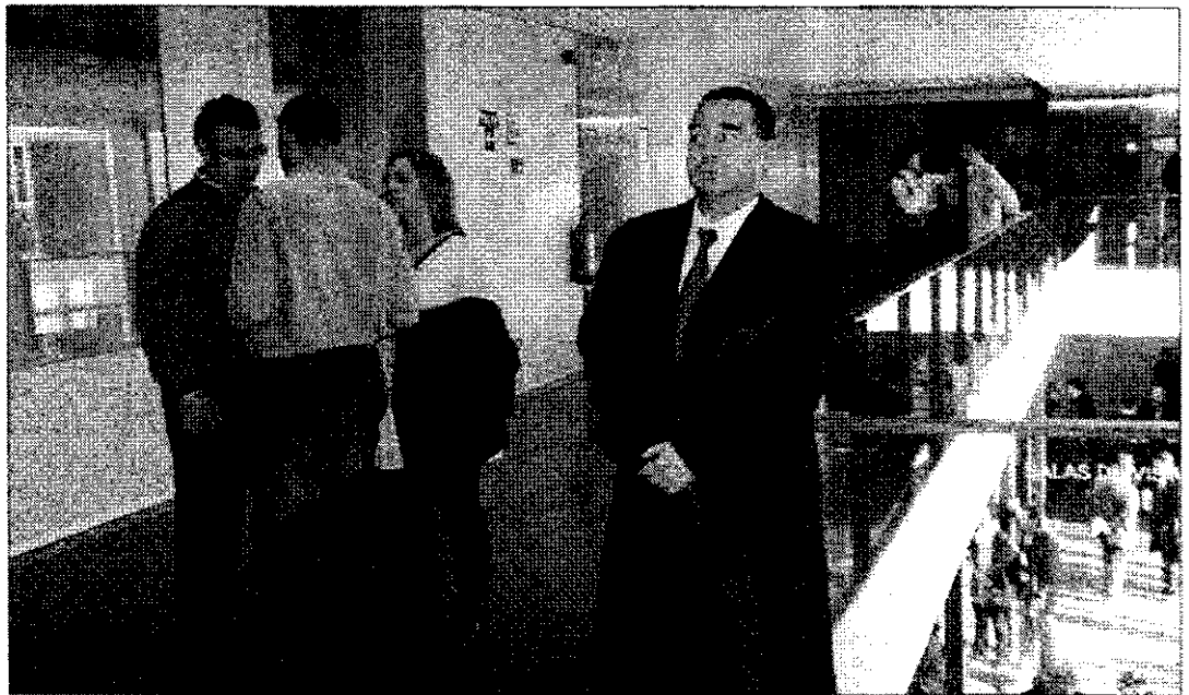
Un colegiado espera en los pasillos de los Juzgados de Salamanca.

En estos momentos, Salamanca cuenta con doscientos sesenta y un abogados apuntados al turno de oficio -cifra va en aumento-, lo que permite garantizar el artículo 119 de la Constitución española, que reconoce el derecho de todos los ciudadanos a tener un abogado y que afecta a otros derechos del individuo, según explica el