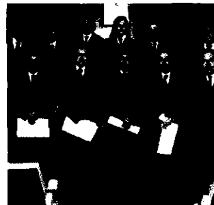
Letrados que cumplieron sus Bodas de Plata.

Tras la finalización del acto se celebró en el restaurante La Taula, la Gran Cena de Gala. Posteriormente se hizo entrega de los trofeos de los diversos campeonatos desarrollados durante estos días de festividad. La noche terminó con baile.