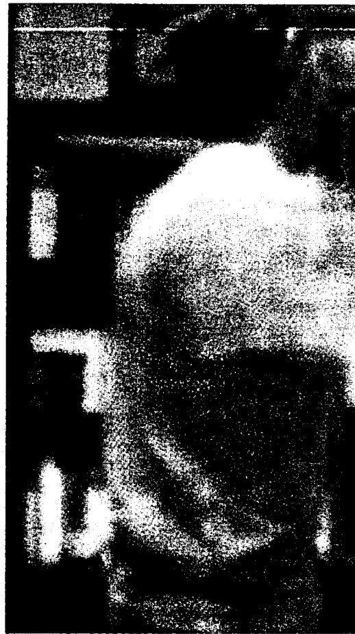
El 80% de las denuncias son por malos tratos físicos. (ARTURO PÉREZ)

El abuso y maltrato contra la mujer afecta enormemente la salud no sólo de ella sino también de sus hijos o personas de su entorno. Para evitar el desmembramiento de una familia es vital que tomemos conciencia de la importancia de la misma, y sobre todo profundizemos en la educación de la igual de géneros.