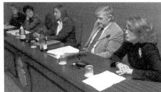
La jornada de ayer sobre Mediación Familiar.

Pero Valdés no pretende contentar a todos. «Presupuestar es gobernar, y la gente puede estar de acuerdo o no con el gasto», subrayó. Consciente del «ronroneo» que hay en los pasillos del colegio ante el gasto que conllevará la creación de una escuela jurídica propia, insistió en que «este centro de formación llevará su tiempo y hasta el momento «no sabemos cuánto dinero va a necesitar» y tampoco si se abordará este mismo año. El decano sí defendió los 24.000 euros que acaparan las actividades festivas «Como hay dinero, entregaremos en el transcurso de una comida las medallas e insignias a los abogados que cumplieron 25 y 50 años de profesión en 2007 y 2008, y que antes no se pudo hacer» por falta de liquidez.