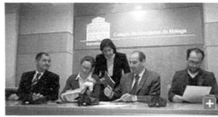
Firma de convenio de solidaridad con Palestina y Bolivia en el colegio de Abogados.

Familias palestinas y bolivianas se favorecerán de la ayuda que el Colegio Oficial de Abogados de Málaga prestará este año con la financiación de tres proyectos de cooperación internacional. Este año serán 21.184 euros lo que esta institución malagueña donará a tres ONG para que puedan llevar a cabo tres iniciativas encaminadas a promover el respeto por los valores democráticos y los derechos fundamentales en territorios conflictivos como es el caso de Palestina.