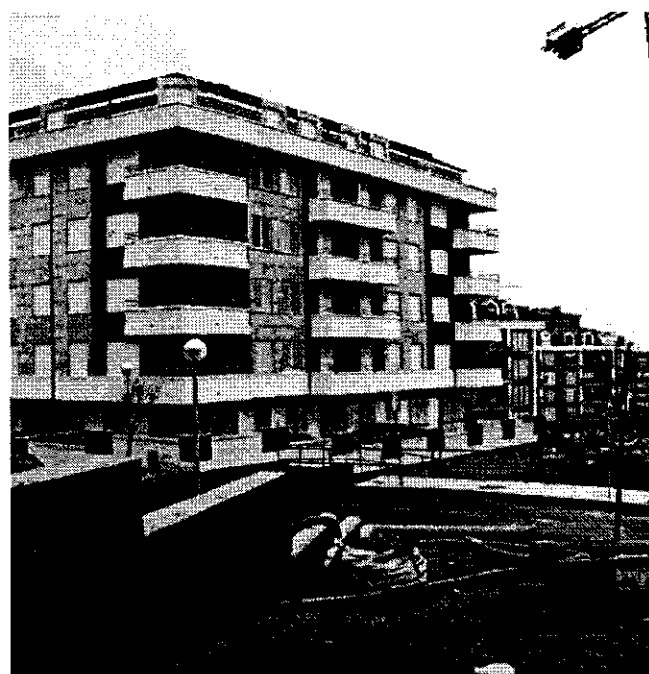
Imagen del edificio promovido por la empresa Urdicam.

El abogado de Urdicam consideró que «lo que no se puede hacer cuando vas a tomarle declaración a un político, es detenerle. O cuando vas a tomar declaración a alguien, le imputas. ¿Para qué?»