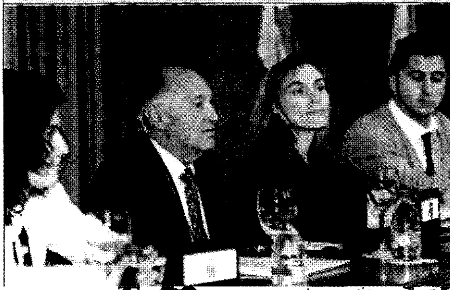
Abogados. Organizado por el Colegio de Abogados de Palencia y la Agrupación de Abogados Jóvenes de Palencia se celebra el I Foro sobre Derecho Penal y Derecho Procesal Penal, que finalizará mañana.