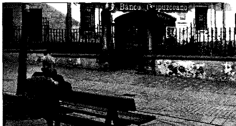
Arriba, la verja de Mondragón con las fotos de etarras. Abajo, ayer, después de ser retiradas.