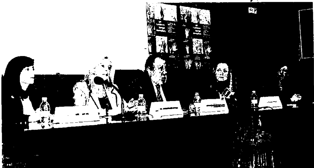
IMPULSORES. Imagen del acto de presentación del concurso de cortos, ayer, en el Colegio de Abogados de Alicante.