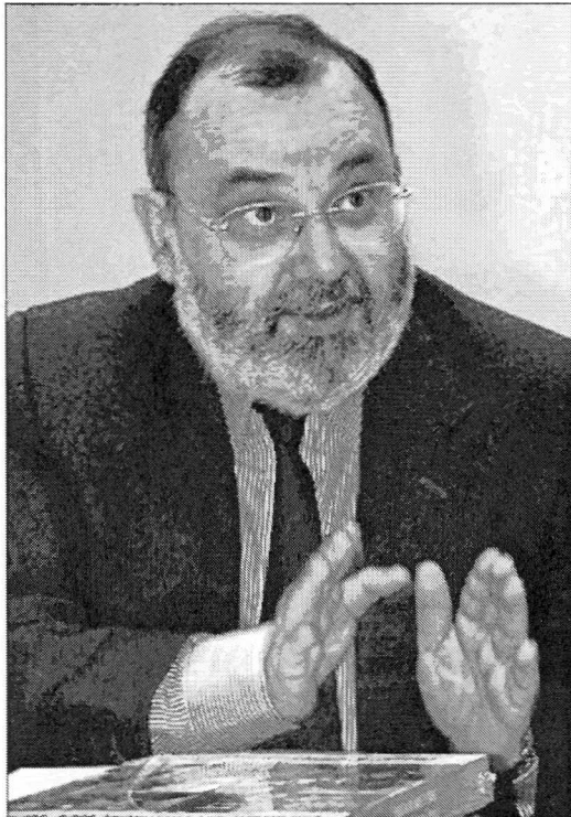
Ángel Juanes, presidente de la Audiencia Nacional.