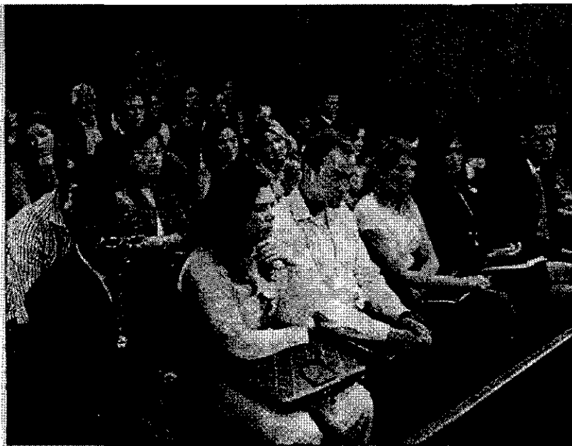
Alumnos de Derecho participan en un simulacro de juicio en la Audiencia Provincial. IZQ. DE A. BARRERA

Más de 450 alumnos de Derecho realizan cada año sus prácticas tanto en las instituciones judiciales de la ciudad como en despachos de abogados o gabinetes jurídicos de distintas empresas o instituciones,