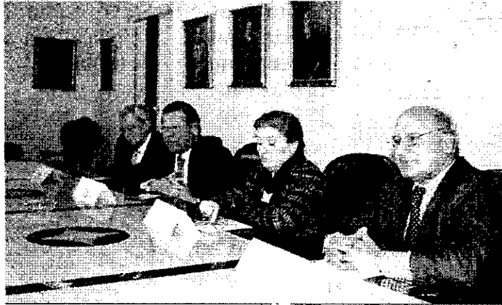
Un momento de la presentación de este curso, en el colegio de abogados.