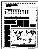
TABLA COMPARATIVA DE LOS SERVICIOS DEL TURNO DE OFICIO

Quantidades en euros obtenidas de la media de los procedimientos