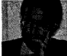
Confianza al decano. NEG