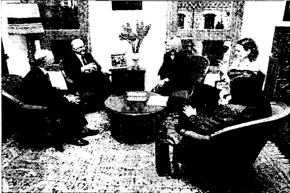
El compromiso regional por la formación de estos profesionales quedó patente en la reunión entre Barreda y Rouco en febrero. P.F.