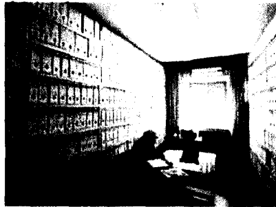
Un abogado bucea en los archivos del Juzgado de Sevilla

Nueve de cada diez abogados andaluces consideran que la Administración de Justicia padece una crisis "muy grave y profunda", y necesita una "refundación" para adaptarse a las necesidades sociales, según una encuesta entre 625 letrados de la comunidad.