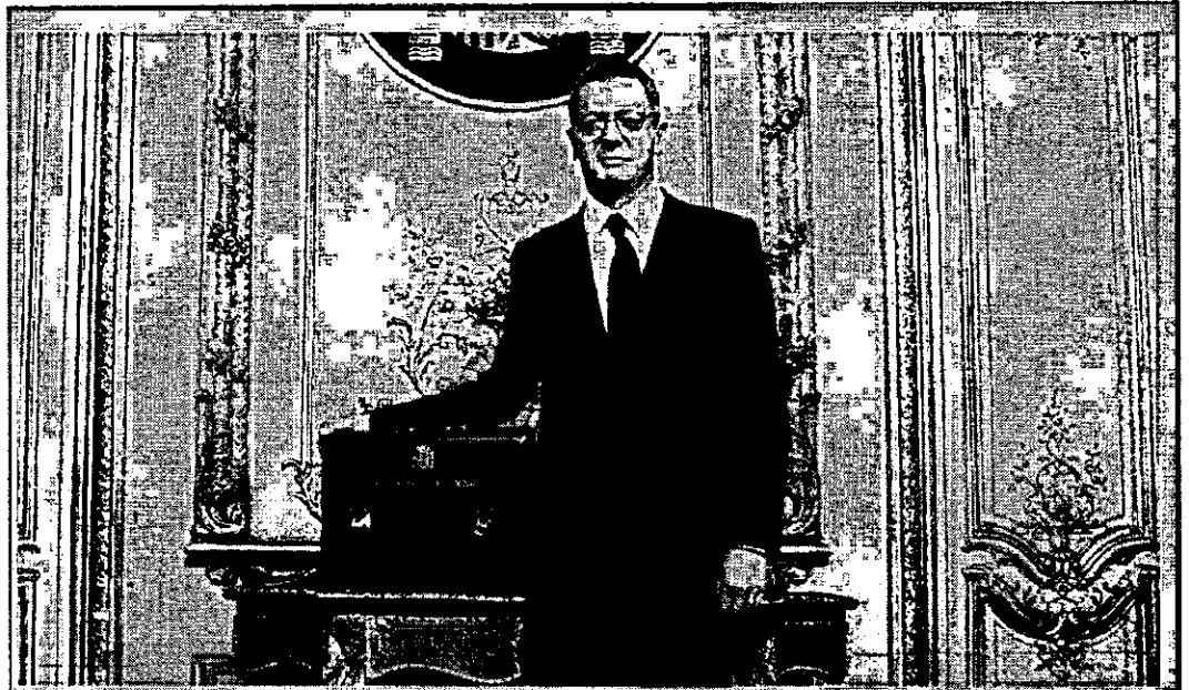
Alberto Ruiz-Gallardón, ministro de Justicia.

El sector contaba con que estos Decretos los aprobara uno de los dos últimos Consejos de Ministros del Gobierno socialista en funciones. Pero no ha sido así. Fuentes cercanas al proceso alertan de que el desarrollo se retrasa porque el Consejo de Estado debe analizar los tres Decretos y no ha podido tener sus conclusiones antes de que acabara el