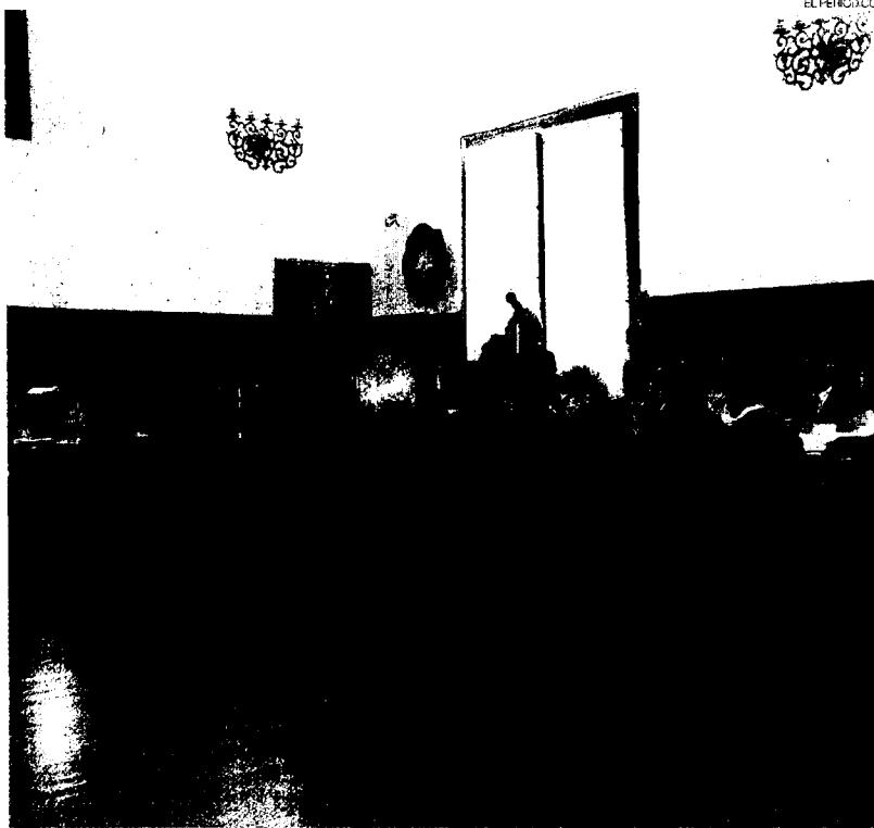
Los letrados que cubren el turno de oficio realizaron el año pasado más de 12.500 procesos.