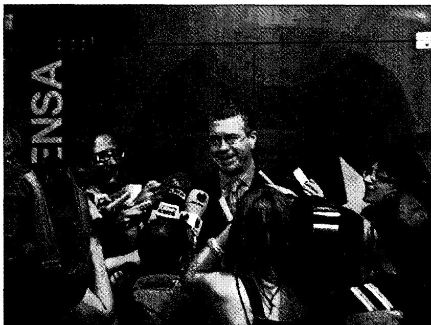
El consejero de Presidencia, Interior y Justicia, Francisco Granados, con los periodistas.

La ley que rige el servicio de justicia gratuita (se otorga a quienes carecen de recursos económicos y a cualquier detenido sin abogado) se aprobó en 1996. Los inmigrantes figuran entre los principales beneficiarios. “El aumento de la población extranjera ha repercutido en un mayor número de usuarios”, según el decano. Y ha crecido la factura que debe pagar el Gobierno regional.