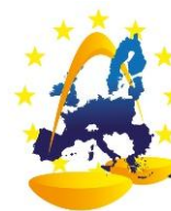
Red Judicial Europea en materia Civil y Mercantil

La Red Judicial Europea en materia civil y mercantil ha celebrado recientemente en Bruselas su X Reunión plenaria de los puntos de contacto nacionales. Junto a los representantes del Ministerio de Justicia y del Consejo General del Poder Judicial, se encontraban representantes de la Abogacía y de otras profesiones jurídicas por segunda vez, desde la apertura de la Red en 2010. Las sesiones del primer día han abordado temas como la organización y funcionamiento de las redes judiciales a nivel nacional, el estudio de la Comisión sobre el Reglamento 1206/2001, relativo a la prueba, o la presentación por parte de la Comisión del estudio sobre la Orden europea de títulos ejecutivos (Reglamento 805/2004); de la misma manera se ha discutido el enfoque operacional de la Red para 2012, abordando prioridades, como la formación (abierta también a todas las profesiones jurídicas recientemente). El segundo día ha estado dedicado a los grupos de trabajo de la propia Red, actualizándose los trabajos del grupo sobre Derecho de Familia en mediación así como los del grupo sobre la Orden europea de pago o el de reclamaciones de escasa cuantía, entre otros. Igualmente, se ha abordado el papel del abogado de oficio en conflictos transfronterizos a nivel lingüístico, la financiación de proyectos y la comunicación de acciones.