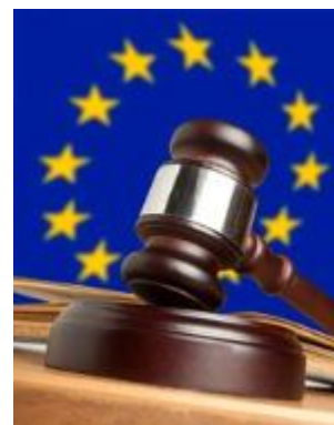
Financiación de Proyectos en Formación Judicial

La Dirección General de Justicia de la Comisión Europea ha lanzado una convocatoria específica de propuestas para la financiación de proyectos en formación judicial, y extensible al resto de profesiones relacionadas con la Justicia, en particular la Abogacía. Se trata de la primera vez que la Comisión Europea establece una línea presupuestaria exclusiva para proyectos de formación. La dotación asciende de 5 millones de euros. Esta convocatoria tiene como objeto la formación de profesionales jurídicos en derecho de la Unión Europea o en derecho de otro Estado miembro, la creación de materiales formativos y otras actividades vinculadas con la formación. Las candidaturas que se presenten deben incluir al menos organismos de dos Estados miembros. La Comisión Europea invita a los solicitantes a observar los resultados de las jornadas sobre buenas prácticas en formación judicial europea realizada en Bruselas en junio de este año. Los criterios de concesión son flexibles, al tener presentes no sólo las prioridades de la Comisión Europea, sino también las necesidades formativas reales de los profesionales. La fecha límite para la presentación de propuestas finaliza el 17.11.2014.