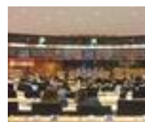
Imagen del evento