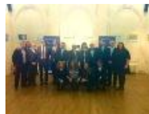
Equipos de la Delegación española en uno de los actos del 20 aniversario y del pleno de CCBE