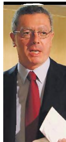
Alberto Ruiz Gallardón.

La Abogacía Catalana advierte también al de que el Gobierno no debe modificar o crear leyes "bajo la presión de las fuerzas mediáticas", y recuerda que "la prisión constituye el fracaso de la sociedad", por lo que propone que la política criminal se oriente hacia las penas alternativas que faciliten la inserción, y de esta manera se descongestionen también las cárceles y se reduzca el gasto público. También han querido recordar que España "es el país de la Unión Europea con la tasa de encarcelamiento más alta" a pesar de que tiene "el índice más bajo de criminalidad".