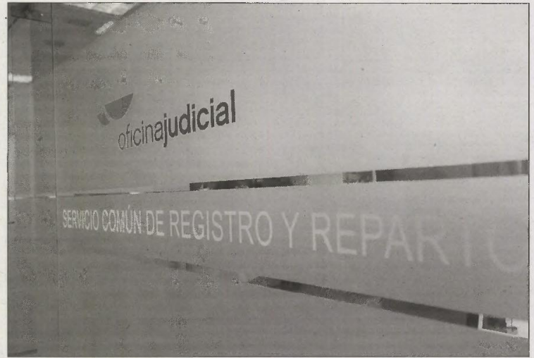
Imagen de archivo de las instalaciones de la Oficina Judicial. JAVIER QUINTANA

«El Colegio de Abogados es consciente del enorme esfuerzo que tanto numerosos funcionarios como procuradores y todo el colectivo de Abogados están