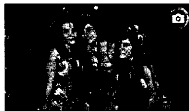
Ver otras galerías de fotos >