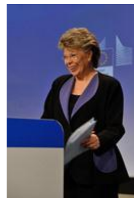
Viviane Reding durante la presentación del informe

La Comisión Europea ha publicado esta semana un nuevo informe sobre la igualdad de género, que llega un año después de que la Vicepresidenta de la Comisión y responsable de Justicia, Viviane Reding, instara a las empresas que cotizan en bolsa en Europa a aumentar voluntariamente el número de mujeres en sus consejos de administración, firmando el "Compromiso a favor de un mayor número de mujeres en los consejos de administración en Europa". El informe muestra que no se ha avanzado mucho hacia el objetivo de aumentar la presencia de mujeres en consejos de administración europeos, ya que en la actualidad solo 1 de cada 7 miembros de estos consejos de administración es mujer. El informe aporta datos que demuestran que la igualdad de género en los puestos superiores contribuye a un mayor rendimiento empresarial, un aumento de la competitividad y la obtención de beneficios económicos. La Comisión desea recabar opiniones sobre una posible actuación a nivel de la UE, incluidas medidas legislativas, con el objetivo de corregir el desequilibrio de género en los consejos de administración de las empresas, y por ello ha puesto en marcha una consulta pública , abierta hasta el 28.05.2012, y que encontrarán referenciada en el siguiente epígrafe.